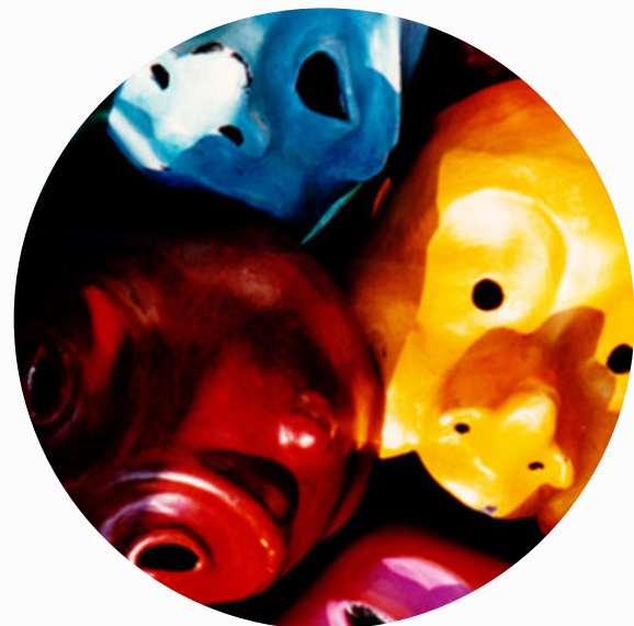
Demi masques pour les ateliers