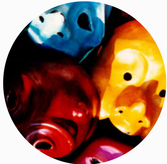
Demi masques Pour les ateliers