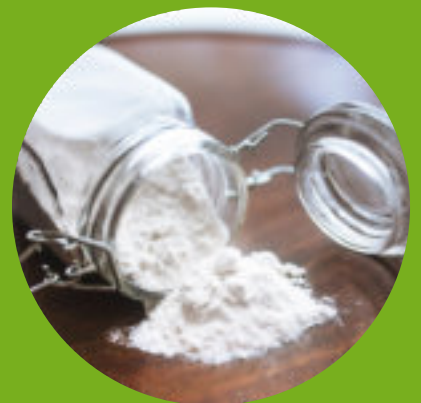
Faire des gâteaux