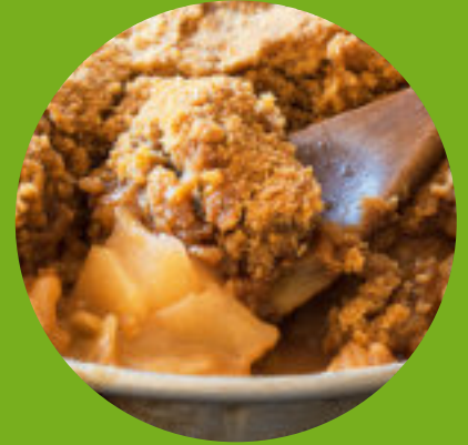
Crumble aux pommes

Le terme " tisane " désigne généralement une infusion ou une tisane de fruits ou d'herbes qui ne contient pas de Camellia sinensis .