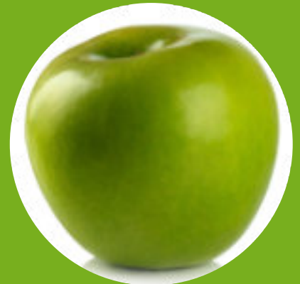
La pomme Granny Smith