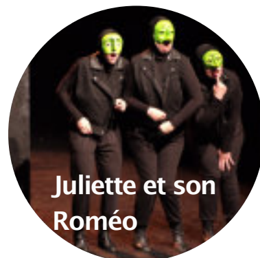
Juliette et son Roméo