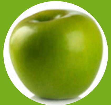
The Granny Smith apple