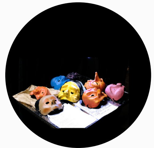
Les masques en création